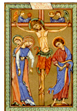
Bénédictines de Caen, d'après le Missel d'Exeter (1228)

Que par la miséricorde de Dieu, les âmes des fidèles défunts reposent en paix. Amen.