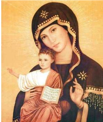
Veni, Creator Spiritus

Viens, Esprit Créateur, Vivificateur, Sanctificateur ; visite les âmes de ceux qui T'invoquent ; verse la grâce en abondance dans les cœurs que Tu as créés ;